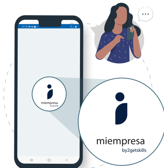
Logo de tu empresa

La empresa tiene una app de micro-aprendizaje, con su propio logo y look and feel , con una puesta en práctica inmediata, soportada por tecnología de última generación y las mejores prácticas para transformar la productividad de los equipos de trabajo y la empresa.